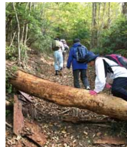
倒木がある小石が多い登山道に登る