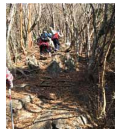
少し歩くとも岩場になる