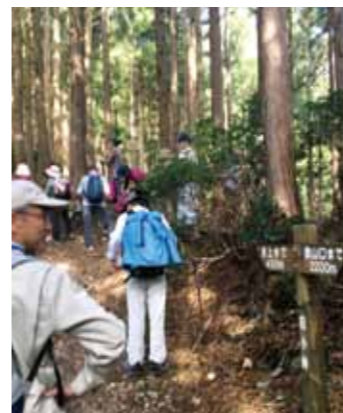
小峠到着、看板あり