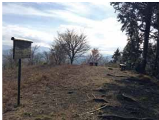
ゆったりとした景色の良い頂上到着

登山口から山頂までの看板は、朽ちており確認が難しい状況です。登山口から第二展望台までは、上り坂が続きますが、その後は比較的緩やかな道です。登山口近くのコンクリート舗装の道は、滑りやすい為、しっかりと靴を履く必要があります。出来ればトレッキングシューズをおすすめします。