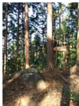
コンクリート舗装を含む上り坂の後、尾根へ続く