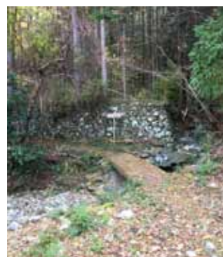
駐車場そば登山口出発