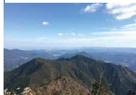
山頂からの眺望/西伊勢湾