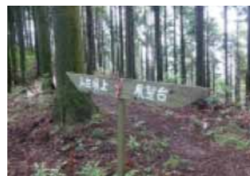
比較的平坦な登山道を行き、展望台と頂上分岐点

第二・第三展望台の眺望はあまり良くないですが、山頂は絶景です。携帯電話の電波も届きます。ガラ場が少なく、小学生や年配者でも歩けるレベルです。