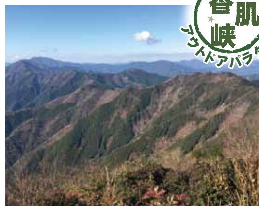
山容からの眺望/東栗木・三峰山

ピラミッド型の姿から「南伊勢の槍ヶ岳」と呼ばれています。山頂では360°のパノラマが広がり、東に伊勢湾、西に栗木岳、高見山を望むことが出来ます。堀坂山、白猪山とともに「伊勢三山」と呼ばれています。(上り坂が多く、倒木が3カ所ほどあり、人工林から自然林へ、小峠を過ぎ頂上付近は、岩場が多く、帰りは、ガラ場の落ち葉や小石等により滑りやすいので注意が必要です。樫の滝コースとありますが、現在は見られません。携帯電話の電波は届きます。