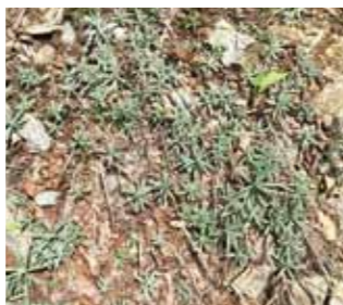
ハハコグサの群生