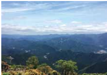
八丁平からの飯高方面眺望