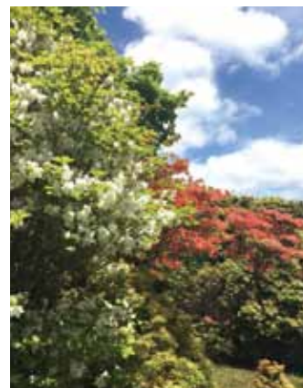
八丁平のシロヤシオと山ツツジ