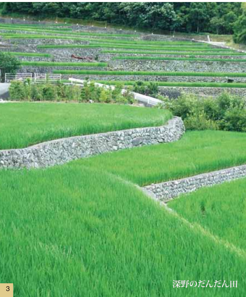
深野のだんだん田