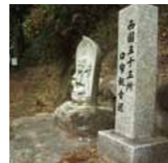
西国三十三所写し霊場 第一観音像